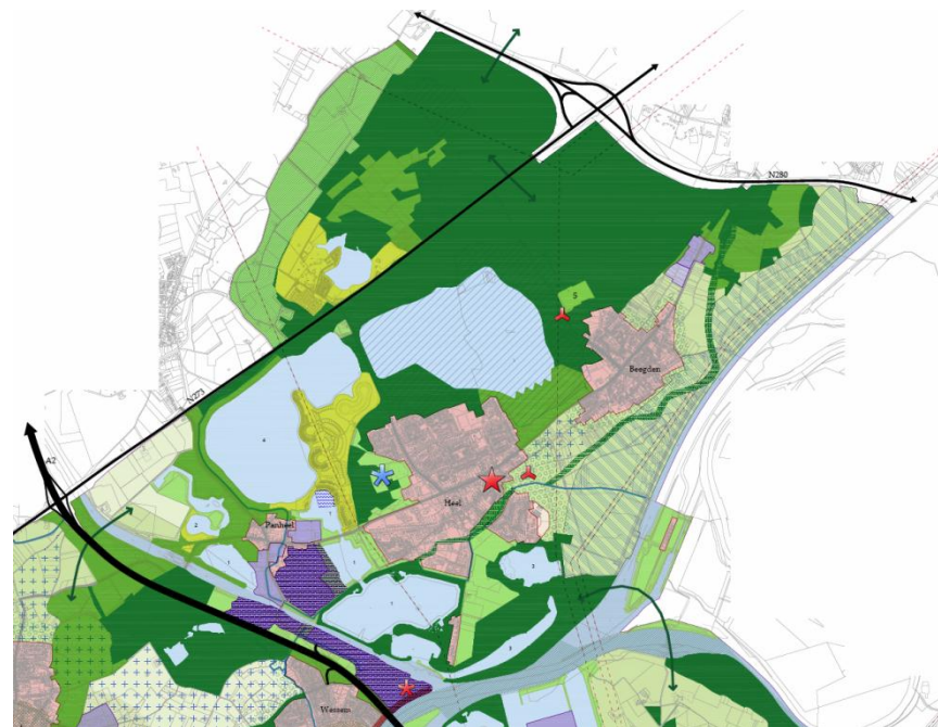
De landschappen binnen het Bosrijk

Het bosgebied "De Beegderheide" heeft binnen Maasgouw een eigen karakter en bestaat uit een afwisseling van bos, heide, stuifzand en een groot aantal kleine en grote vennen. Het gebied ontleent zijn hoge natuurwaarden aan soorten planten en dieren die aan vennen zijn gebonden. Zuidwestelijk van de Beegderheide ligt het natuurgebied Tuspeel. In dit gebied stagneert water door een kleilaag in de ondergrond. Hierdoor zijn enkele vennen ontstaan. Tuspeel kent een waardevolle hoogveenvegetatie. De natuurwaarden zijn vergelijkbaar met de Beegderheide.